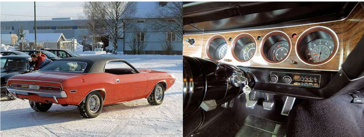
Viimeistelyä vaille valmis täysentisöinnin tulos. Sisusta on radiota myöden alkuperäinen ja täysin toimintakuntoinen.