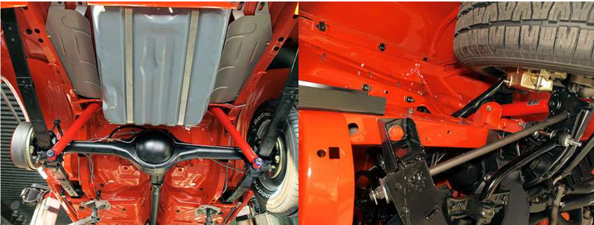
Auton pohjaa ennen pakoputkien asennusta. Kunnostettua alustaa.