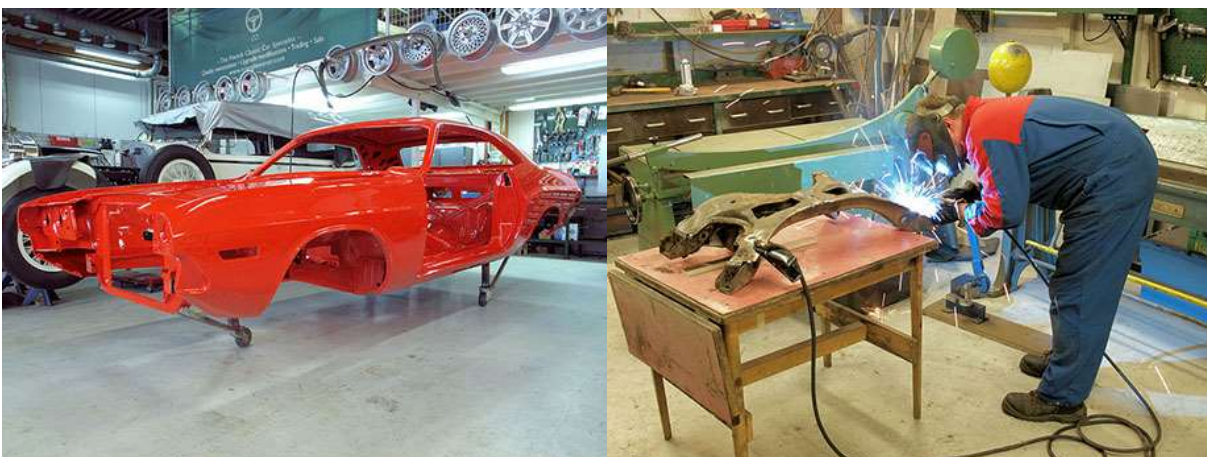
Kunnostettu kori maalattiin alkuperäisellä oranssilla. Apurungossakin oli hieman korjattavaa.