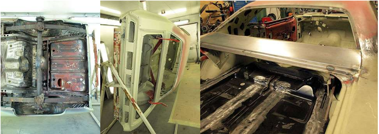
Peltipuhdasta pohjaa. Korin pohjamaalausta. Ruosteauriot korjattiin uusien korjauspaloin, joista osa saatiin valmiina ja osa valmistettiin käsityönä.