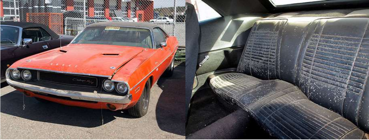
Auto ennen projektin aloitusta. Sisusta oli päässyt homehtumaan.