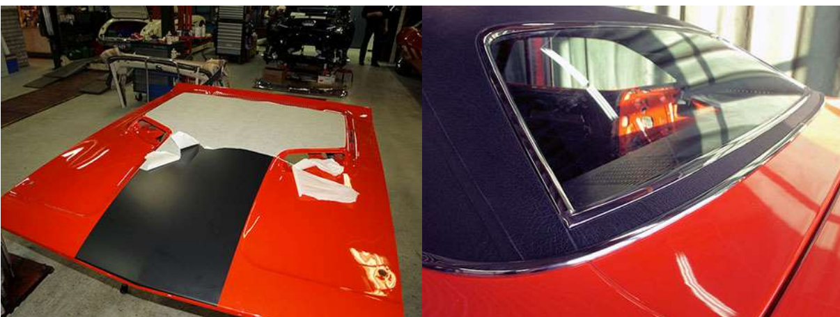
Häijympää ilmettä tavoiteltiin teippaamalla konepeltiin musta raita. Osaavilla käsillä asennetuista oikeista osista syntyy virheetön lopputulos.