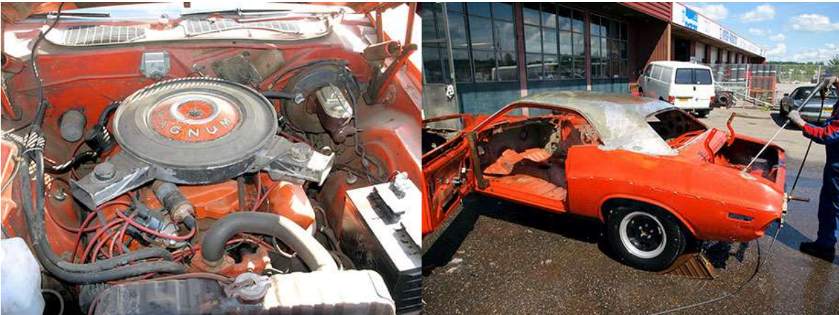
Moottoritila oli lohduuttomassa kunnossa. Purun jälkeen auto pestiin ja puhdistettiin perusteellisesti.