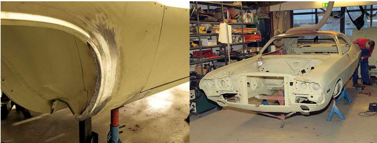
Lokasuojan kaaret korjattiin uudella pellillä ja koritinalla. Korin peltitöitä.