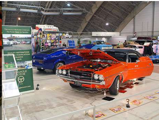
Entisöintityön tulos on kansainvälistä huippuluokkaa.