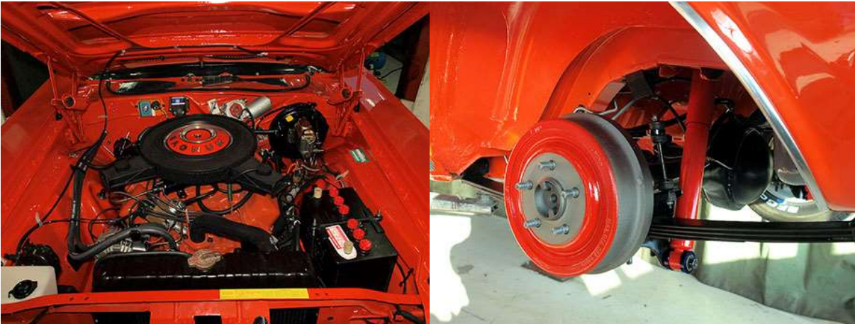
Täysin uutta vastaava moottoritila. Kaikki alustan kulutusosat uusittiin.