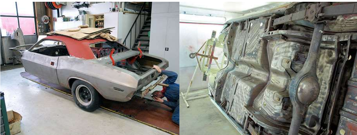
Pintapellit olivat säilyneet suhteellisen hyvässä kunnossa. Auto puhdistettiin ja maalattiin myös alta.