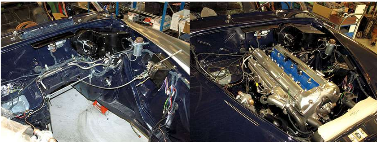
Puhdas moottoritila. Alkuperäinen moottori kunnostettuna takaisin paikallaan.