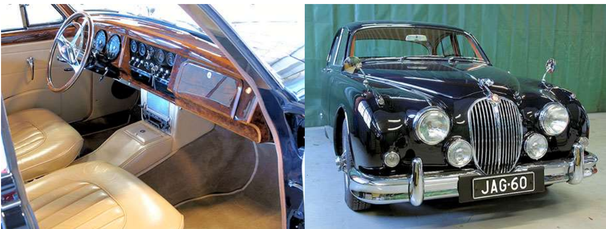
Myös verhoilut entisöitiin uutta vastaaviksi. Auto sai myös arvoisensa rekisterikilven.