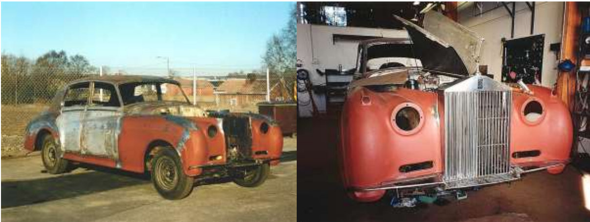
Peltiseppämme palautti auton takaisin alkuperäiseen ryhtiinsä. Kaikki osat istuivat paikoilleen kuten niiden pitääkin.