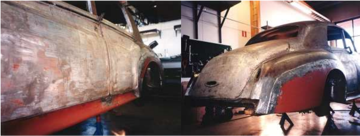
Tehtyjen peltitöiden määrä on valtava. Kunnostettu takakulma.