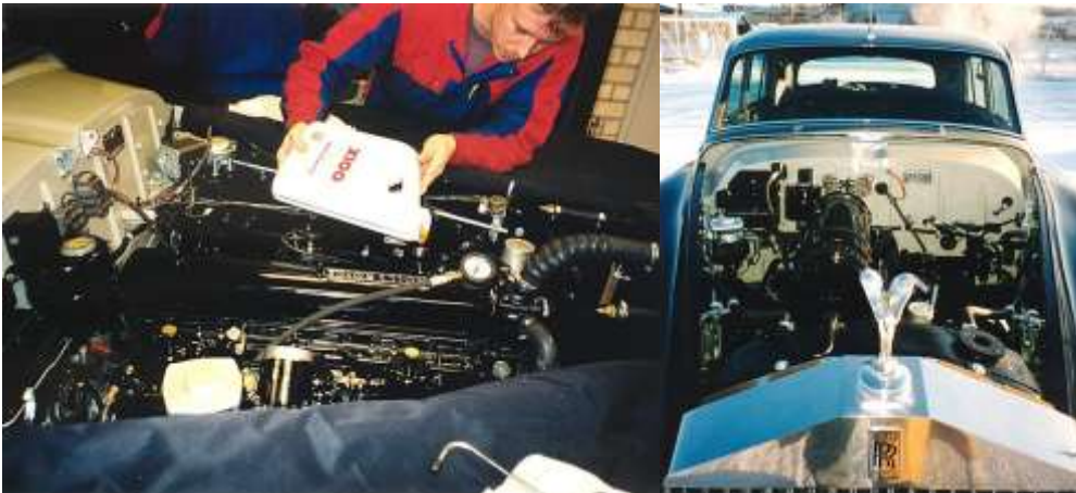
Täyskunnostettu moottori sai sisälleen uudet öljyt ennen ensimmäistä käynnistystä ja koeajoa, joka suoritettiin onnistuneesti.