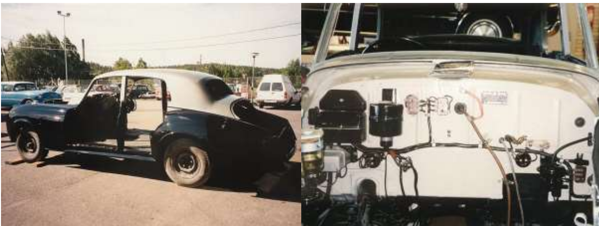
Kori juuri maalaamosta tulleensa. Edessä on vielä verhoilun valmistus ja loppujen koripeltien asennus. Siistiytynyt moottorilta toimivine komponentteineen.