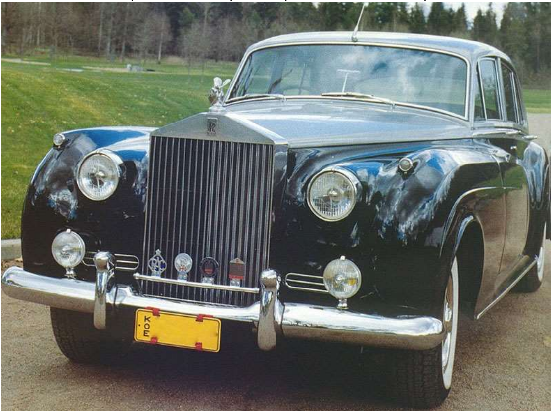
Auton entisöinnin taso on kansainvälistä huippuluokkaa.