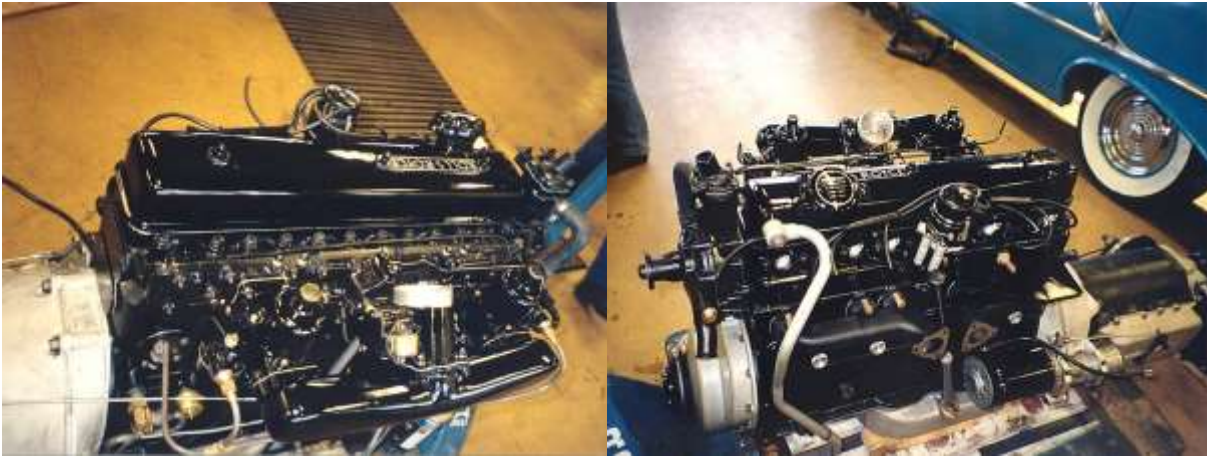
Perusteellisesti kunnostettu moottori.